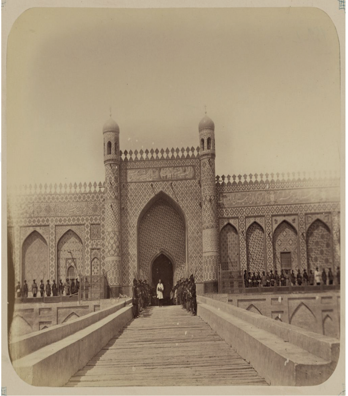
Ek-16: Hokand (Fergana) Hanlığı'nın XIX. yüzyıldaki görünümü.