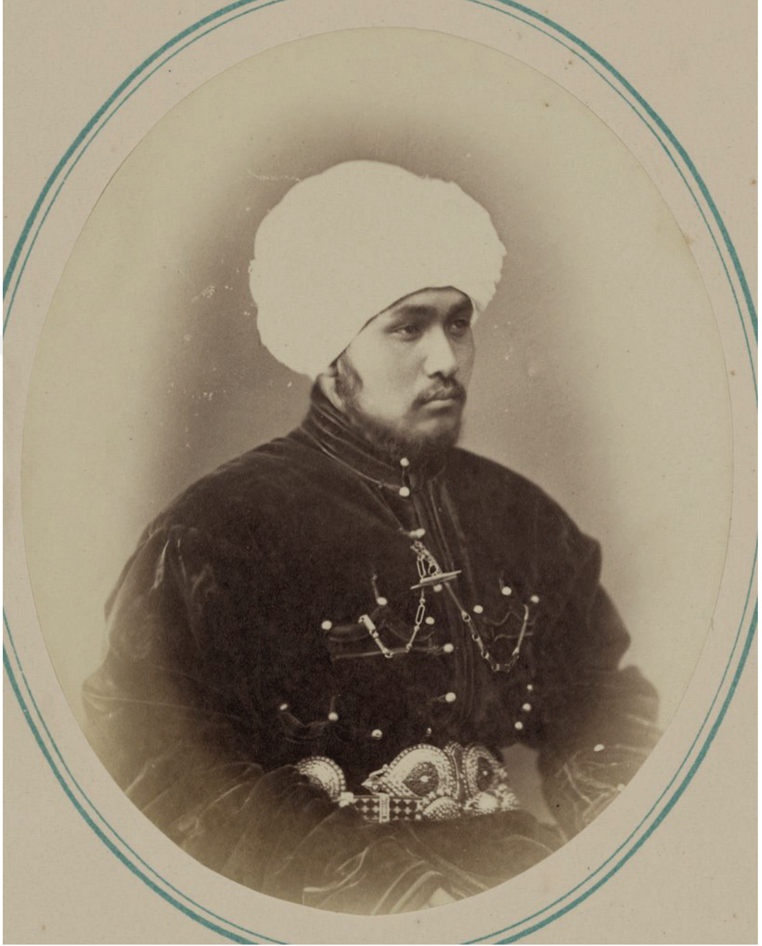
Ek-12: Hudayar Han'ın ođlu Muhammed Nasreddin Bek (1818-1882).

Kaynak: https://www.wdl.org/ru/item/10719/#q=кoкандского&q1a=ru (Ulařım Tarihi: 05.02.2019).