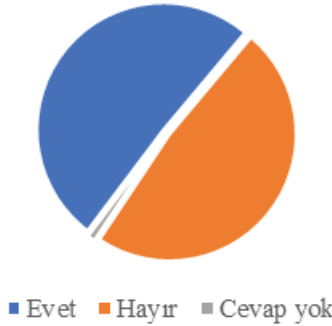
Grafik 3: Katılımcıların mezuniyet sonrası ilk yıllarda 60 yaş ve üzeri bireyler ile birlikte çalışmayı isteyip istememe durumu

Grafik 3'te görüldüğü üzere gençlere mezuniyet sonrası çalışma yaşamında 60 yaş ve üzeri bireyler ile birlikte çalışma arkadaşı olmak ister misiniz sorusuna katılımcıların 329'u (%51) evet; 312'si (%48) ise hayır cevabını vermiştir. Diğer bir ifade ile katılımcıların neredeyse yarısı hayır cevabı vermişlerdir.