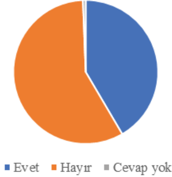
Grafik 2. Katılımcıların 60 yaş ve üzeri hocalardan ders almayı isteyip istememelerine ilişkin görüşleri

Grafik 2’de görüleceği üzere katılımcıların 374’ü (%58) 60 yaş ve üzeri hocalardan ders almak istemediklerini belirtmişlerdir. Diğer taraftan katılımcıların 269’u (%41) 65 yaş ve üzeri hocalardan ders alabileceklerini belirtmişlerdir. Bunun nedenlerini sorulduğunda çeşitli gerekçeler dile getirilmiştir. Yaşlı hocalardan ders almak istemediklerini belirten 374 katılımcıdan 138’i (%37) buna bir gerekçe göstermiştir. Gerekçeler kategorik içerik analizine tabi tutulmuş ve sonuçlar aşağıda tablo 2’de gösterilmiştir.