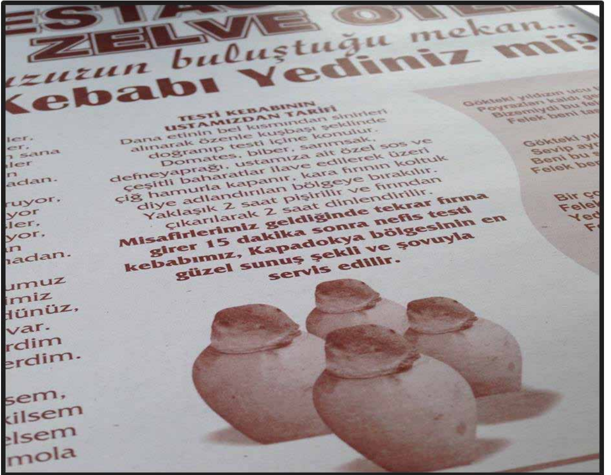
Resim1: Bir yiyecek İçecek İşletmesinin Testi Kebabı Tanıtımı