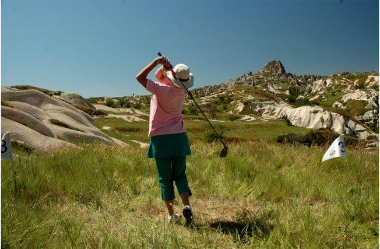
Resim 1. Cross Golf Turnuvasından Bir Kare

Türkiye Turizm Stratejisi 2023 Eylem Planı kapsamında golf turizminin günümüzde faaliyet gösteren bölgelerden farklı yerlerde de yapılması öngörülmüştür. Bu nedenle Frigya, Kapadokya, GAP, Urartu gibi belirlenen çeşitli turizm gelişim bölgelerinde golf turizminin geliştirilmesine yönelik adımların atılması öngörülmüştür (Boz, Gülüm ve Çoban, 2010: 696). Belirlenen eylem planına uygun olarak Kapadokya Bölgesi'nde golfe yönelik çalışmalar başlamıştır.