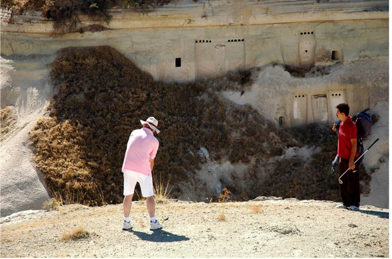
Resim 2. Cross Golf Turnuvasından Bir Görüntü