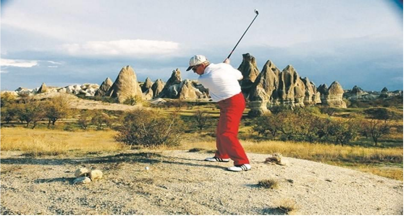
Resim 3. Cross Golf' ün Kapadokya Bölgesi'nde Oynanabileceğine İlişkin Tanıtım Karelerinden Bir Görsel