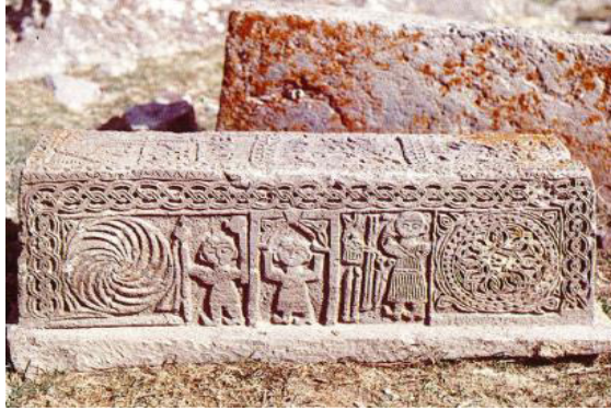
Fotoğraf 15. Azerbaycan, Sisiyan Bölgesi'nden 16. yy'a Ait Sanduka (Rasim Efendiyev'den)