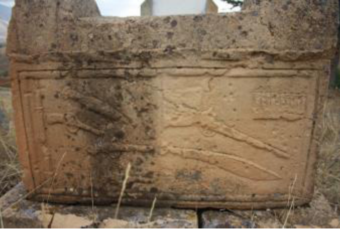
Fotoğraf 17. Gümüşali Köyü, Çeşitli Ateşli Silahlar ve Kesici Objeler

Bıçak, hançer, kılıç gibi kesici aletler ve tabanca tüfek gibi ateşli silahlar Gümüşali ve Karapınar köylerindeki mezar taşlarında yer alır (foto. 17-18). Yan yüzlere yapılan tüfek ve kılıcın yanı sıra ayak taşına işlenmiş tabanca ve tüfek süslemeleri vardır. Bunlar kabartma ve kazıma yöntemi ile yapılmışlardır. Orta ve İç Asya'da oldukça erken tarihlerden itibaren Türklerde ve diğer bozkır topluluklarında, geyikli taş veya sin taşı olarak anılan mezar taşlarının üzerinde balta, kazma gibi aletlerin yanında kılıç, hançer veya bıçak gibi tasvirlerin de yer aldığı çeşitli çalışmalarla ortaya konulmuştur (Çoruhlu, 1997: 61). Bu açıdan bölgenin mezar taşı süslemelerinde kültürel sürekliliği devam ettirdikleri görülmektedir. Ateşli silahların 18. yüzyılda kullanılmaya başlanmasıyla kesici aletlerle birlikte ateşli silahların mezar taşı süsleme programına girdiği ve çokça kullanıldığı bölgesel olarak hazırlanan mezar taşı ile ilgili çalışmalardan anlaşılmaktadır.