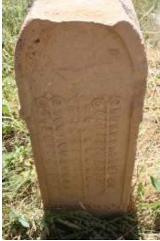
Fotoğraf 9. Ördekli Köyünde Bulunan Hayatağacı Üzerinde Kuş Tasviri

Koçgiri mezar taşlarında görülen bezemelerden birisi de kuştur. Ördekli Köyünde, hayatağacı üzerinde bir kuş figürü bulunmaktadır (foto. 9). Bu tek örnekten başka bir örnekte aynı biçimdeki hayatağacının üzerinde kuşun bulunması gereken kısmın tahrip olduğu görülmektedir. Üçüncü örnekte ise hayatağacı betiminin üzerinde kuş yerine ay-yıldız işlenmiştir.