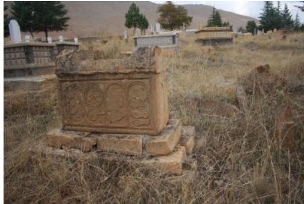
Fotoğraf 20. Gümüşali Köyü Cezveler, Fincan Takımı ve Kahve Kavurma Tavas ı