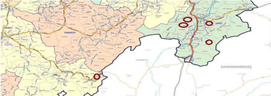
Şekil 1. Kayseri'de Koçgiri Aşiretinin Yerleştiği ve Figürlü Mezar Taşı Geleneği Görülen Köyler

Kayseri'deki bu altı köyün mezarlık yerleşimlerine bakıldığında, figürlü bezemeli ve sanduka formlu mezar taşlarının bulunduğu, Sarız'ın Ördekli ve Develi'nin Karapınar köylerinde cem evlerinin mezarlıkla bitişik olduğu gözlenir.