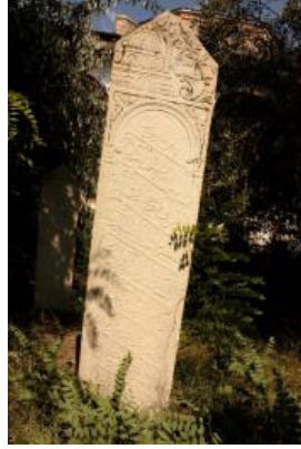
Fotoğraf 14. Aydın Koçarlı Cihanoğlu Camisi Haziresi, Cami Tasvirli Şahide (Muzaffer Yılmaz'dan)