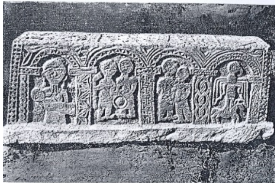
Fotoğraf 16. Azerbaycan, Sisiyan Bölgesi'nden 16. yy'a Ait Sanduka (Rasim Efendiyev'den)