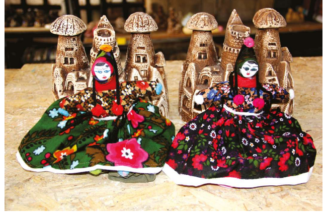
Nevşehir folklorik bebeği

Coğrafi işaret tescili alabilecek geleneksel el sanatları ürün sınıfı içinde Avanos halısı ve Nevşehir folklorik bebeği yer almaktadır. Türk kültürünün en önemli yapı taşlarından birini oluşturan halı ve kilim sanatı, Türklerin geleneksel sanatlarından biri olarak tarih boyunca yerini korumuştur. Halı sanatının Türklerin yerleştiği bölgelerde başlaması