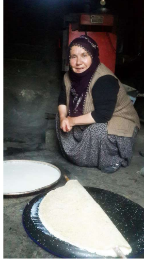
Kaymaklı kuru kaymağı yapım aşamaları.