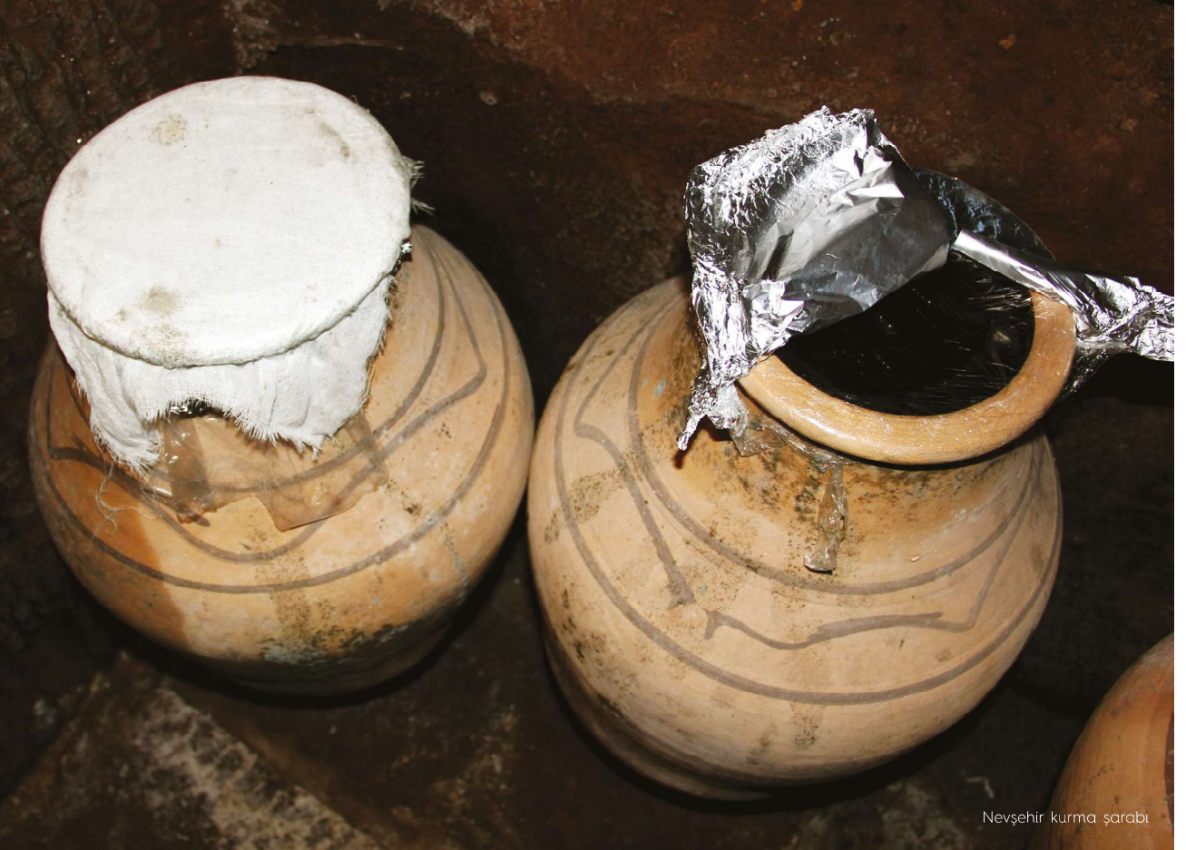
Nevşehir kurma şarabı

Orta Anadolu'da şarapçılık denildiğinde akla gelen önemli merkezlerden biri de Kapadokya'dır. Kapadokya'da şarabın ilk ne zaman ortaya çıktığı tam olarak bilinmemekle birlikte, üzüm yetiştiriciliği ve üzümünden şarap elde etmenin bölge tarihi kadar eski olduğu düşünülmektedir (Hatipoğlu & Şengül, 2011). Nevşehir'in tüflü toprak yapısı bağcılık için oldukça değerlidir. Ayrıca Kapadokya'daki volkanik yapının şarap üretimi açısından diğer önemli özelliği