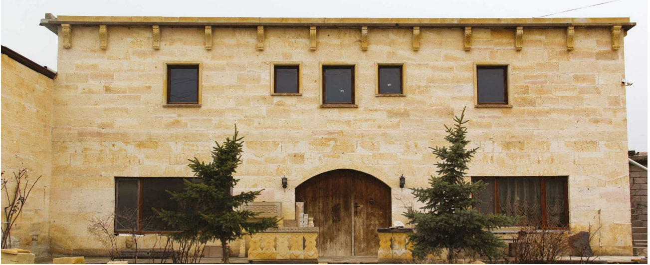
Nevşehir taşı kesim aşamaları ve inşasında Nevşehir taşının kullanıldığı bir konut.

verilen önemin giderek artmasına paralel olarak, pomza taşı üstün özelliklerinden dolayı, inşaat ve yapı endüstrisinde geniş bir kullanım alanı bulmaktadır (Bilgil & Özdel, 2017). Bununla birlikte pek çok sanayi sektörünün de hammaddesini oluşturmaktadır.