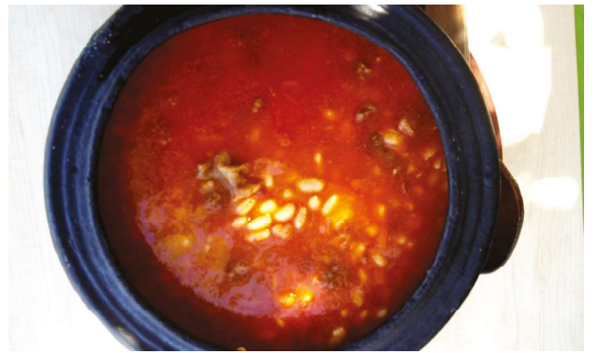
Nevşehir etli tandır ağpaklası