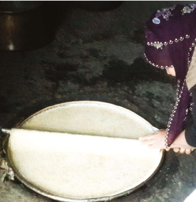
Kaymaklı kuru kaymağı yapım aşamaları.

durumlarda bir ülkenin" adından ibaret olacağı; bu işaretlerin, söz konusu bölge, yöre ya da ülkeden kaynaklanan ürünleri ifade edebileceği belirtilmiştir.