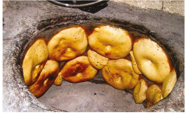
Nevşehir tandır ekmeği