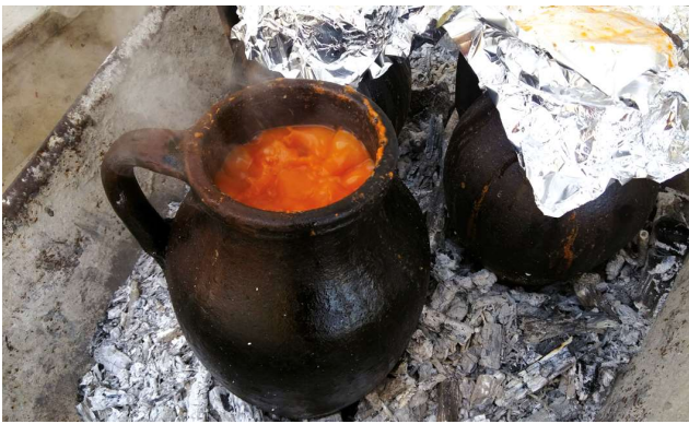
Nevşehir tandır ağpaklası