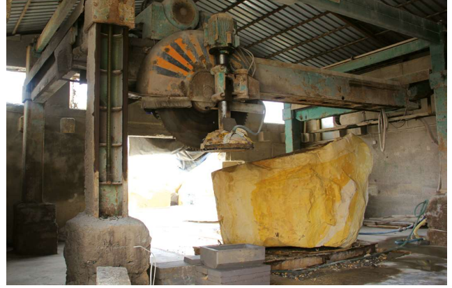
Nevşehir taşı kesim aşamaları