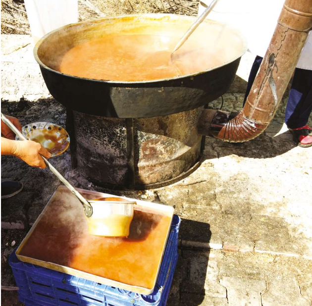
Nevşehir’de üzümden yapılan yöresel ürünlerden köftürün yapım aşaması

Uluslararası Oryantiring Yarışları: 2017 yılı Mart ayında, Türkiye Oryantiring Federasyonu ile Göreme Belediye Başkanlığı ortaklığında, “Uluslararası Oryantiring Yarışları” adlı bir spor etkinliği düzenlenmektedir. 2009 yılından beri her yıl Mart ayınının 20’sinden sonra düzenlenen