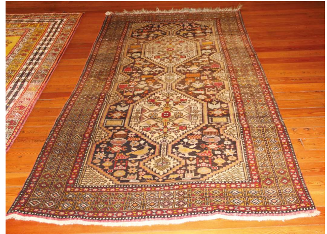
Hava başı modelli Avanos halısı

Ayrıca yöresel gıda üretimine katkısına, turizm faaliyetlerinin gelişmesindeki etkisine ve kırsal kalkınmada lokomotif olabileceğine dikkat çekilmiştir. Yapılan araştırmaların en önemli sonuçları arasında coğrafi işaretlerin; faydalarından yararlanılabileceği, yüksek kalitelide ürün üretimi için gerektiği, doğru, etkili şekilde tanıtımı ve pazarlanması ile bölgesel kalkınmaya sağladığı olanaklar yer almaktadır.