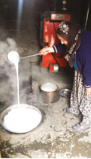
Kaymaklı kuru kaymağı yapım aşamaları