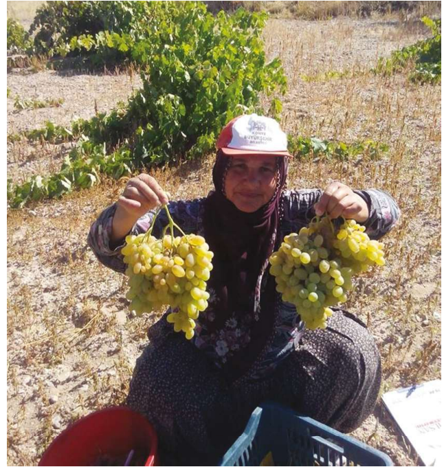
Nevşehir parmak üzümü

Bitkisel Ürünler: İlde coğrafi işarete konu olabilecek bitkisel ürünler dimrit (kara) üzümü, buludu (hevenk) üzümü, emir üzümü, parmak üzümü, çavuş üzümü, Avanos İsmailoğlu üzümü, Avanos armut ayvası, Avanos gub düşen ar-