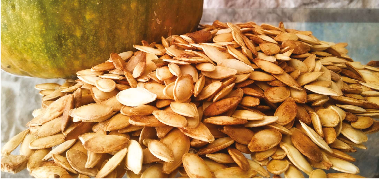
Kavrulmuş Nevşehir kabak çekirdeği

Geleneksel Trap Atışları ve Kültürel Etkinlikler Festivali: Mayısın 2. haftasında Acıgöl Belediye Başkanlığına, "Geleneksel Trap Atışları ve Kültürel Etkinlikler Festivali" düzenlenmektedir. Acıgöl'de ulusal düzeyde dört yıldır düzenlenen festivale 2016 yılında 220'si yarışmacı olmak üzere toplam 1200 kişi katılmıştır. Trap Atış Yarışmaları, A kategorisi atışları, B kategorisi atışları, tek kurşun atışları ve grup atışları olmak üzere dört kategoride yapılmaktadır. Ya-