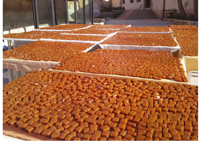
Nevşehir’de üzümden yapılan yöresel ürünlerden köftürün kurutulma aşaması

Belirgin bir niteliği, ünü veya diğer özellikleri itibarıyla kökeninin bulunduğu bir yöre, alan, bölge veya ülke ile özdeşleşmiş bir ürünü gösteren ad veya işaretler coğrafi işaret olarak tanımlanmıştır (Türk Patent Enstitüsü, 2016). Ayrıca belirli bir alandan kaynaklanan bir ürünü tanımlayan ya da kalitesi, ünü veya diğer karakteristik özellikleri bakımından