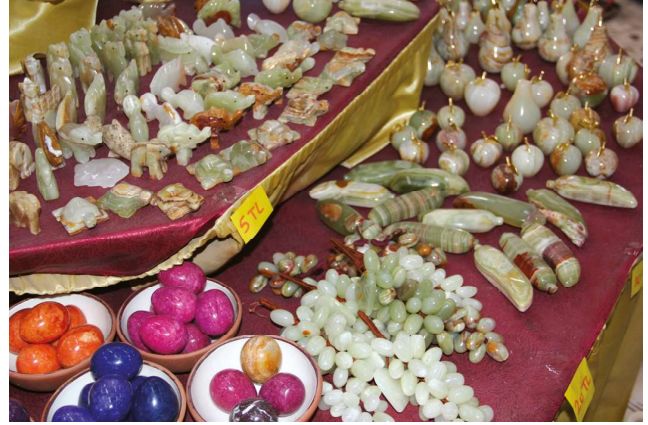
Oniksten yapılmış hediyelik ürünler

Nevşehir için coğrafi işaret potansiyeli taşıyan doğal taş ürünlerinden pomza (sünger taşı), camsı, değişik boyda, delikli, kabarcıklı, bazen özgül ağırlıkları sudan daha az olduğu için su içerisinde yüzebilen, fiziksel ve kimyasal etkenlere karşı dayanıklı, volkanik kökenli bir kayadır (Elmastaş, 2012). Son yıllarda hafif yapı malzemelerine