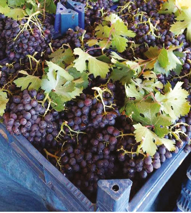
Nevşehir dimrit (kara) üzümü

Nevşehir Ortahisar Belediye Başkanlığı ile Trabzon Ortahisar Belediye Başkanlığı ortaklığında gerçekleştirilmektedir. 6.10.2015 tarihinde Trabzon Ortahisar Belediyesi ve Ürgüp ilçesi Ortahisar Belediyesi arasında imzalanan Kardeş Şehir Protokolü çerçevesinde, belediyeler arası kardeşlik ilişkilerini kuvvetlendirmek ve iki şehir arasında gelenek ve göreneklerin aktarımına katkıda bulunmak amacı ile düzenlenmektedir. Trabzon Ortahisar Belediyesi çalışanlarının da katıldığı, ulusal düzeyde ve halka açık olan etkinlik kapsamında Ortahisar Tepe Başı Meydanında hamsi ikramı yapılmaktadır (Ürgüp Kaymakamlığı, 2017; Nevşehir İl Kültür ve Turizm Müdürlüğü, 2017).