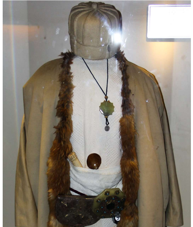
Hacıbektaş Veli Müzesinde sergilenen teslim taşı ve kemer taşı