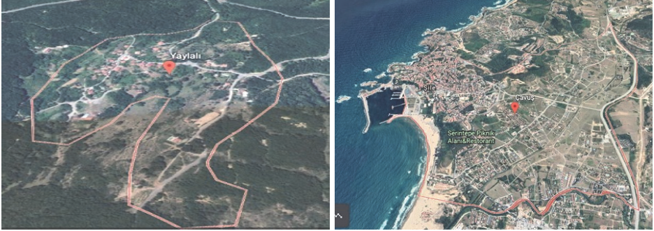
Şekil 3. Yaylalı Mahallesi (Solda) ve Çavuş Mahallesi (Sağda) Google Earth Görüntüleri

İlçede nüfusun dağılımı genel olarak incelendiğinde ise; özellikle kıyılarda yoğunlaşan, iç kesimlere doğru seyrekleşen düzensiz bir yapı ile karşılaşmaktadır. İlçede nüfusu 200 kişinin altında olan 15, nüfusu 1000'nin üzerinde olan 6 yerleşim yeri bulunmaktadır. Bu yerleşim yerlerinden en az nüfuslu olanı 63 kişi ile Yaylalı Mahallesi iken en fazla nüfusa sahip olanı ise 9.381 kişi ile Çavuş Mahallesi'dir (Şekil 3). Nüfusun dengeli bir dağılım göstermediği ilçede, iç kesimler ile merkeze uzak ve ulaşımın nispeten daha zor olduğu ormanlık alanlarda kurulmuş olan mahalleler az nüfuslanmıştır. Kıyılarda kurulan, turizmle elverişli, ulaşımın kolay olduğu ve merkez özelliği gösteren yerleşim yerleri genellikle nüfusun daha yoğun olduğu yerler olarak ön plana çıkmaktadır.