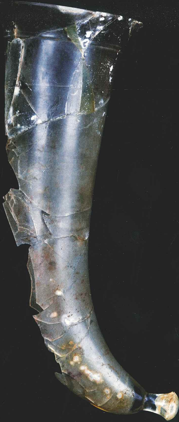
Res. 2: Koru Tümülüsü'nden ele geçen dağ kristali rython