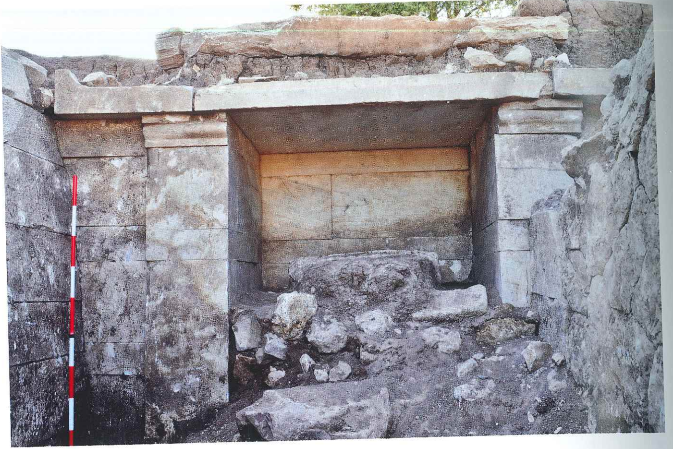
Res. 5: Kocaresul Tümlüsü girişi