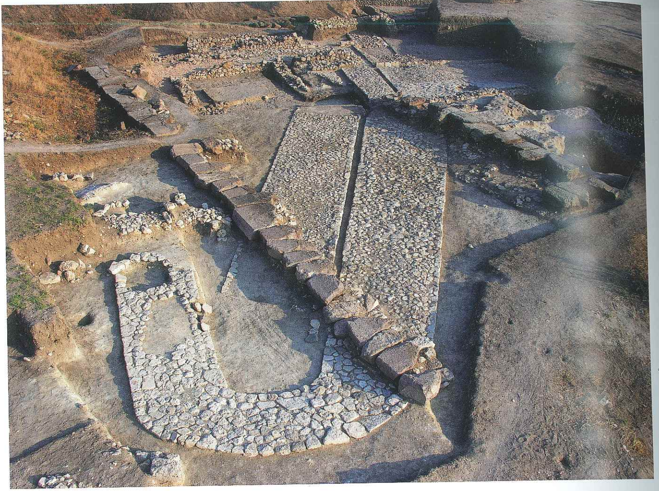
Res. 4: Kült Yolu (Daskyleion Kazı Arşivi)