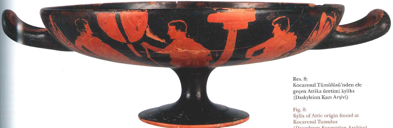
Res. 8: Kocaresul Tümülüsü'nden ele geçen Attika üretimi kyliks