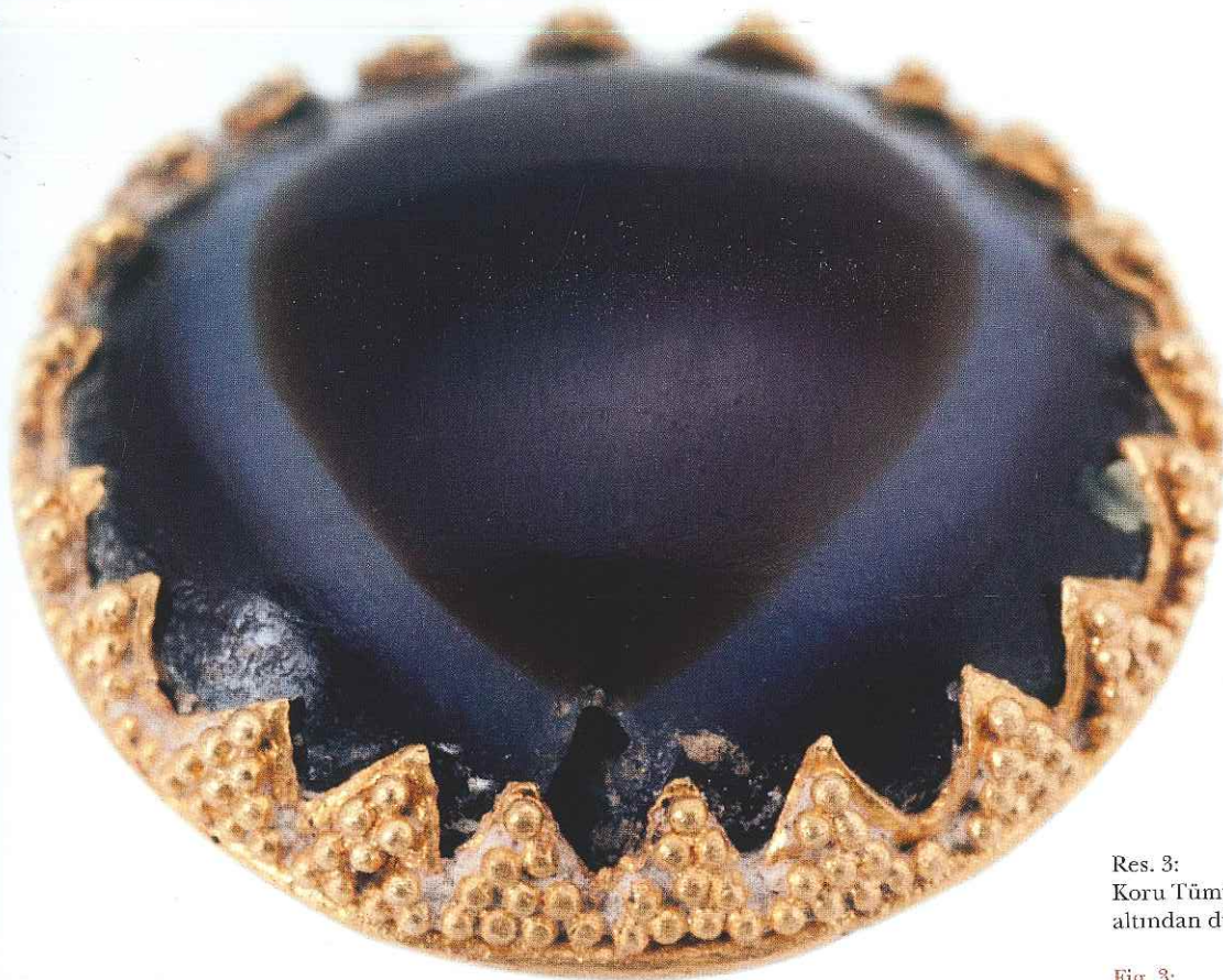
Res. 3: Koru Tümülüsü'nden ele geçen akik ve altından düğme