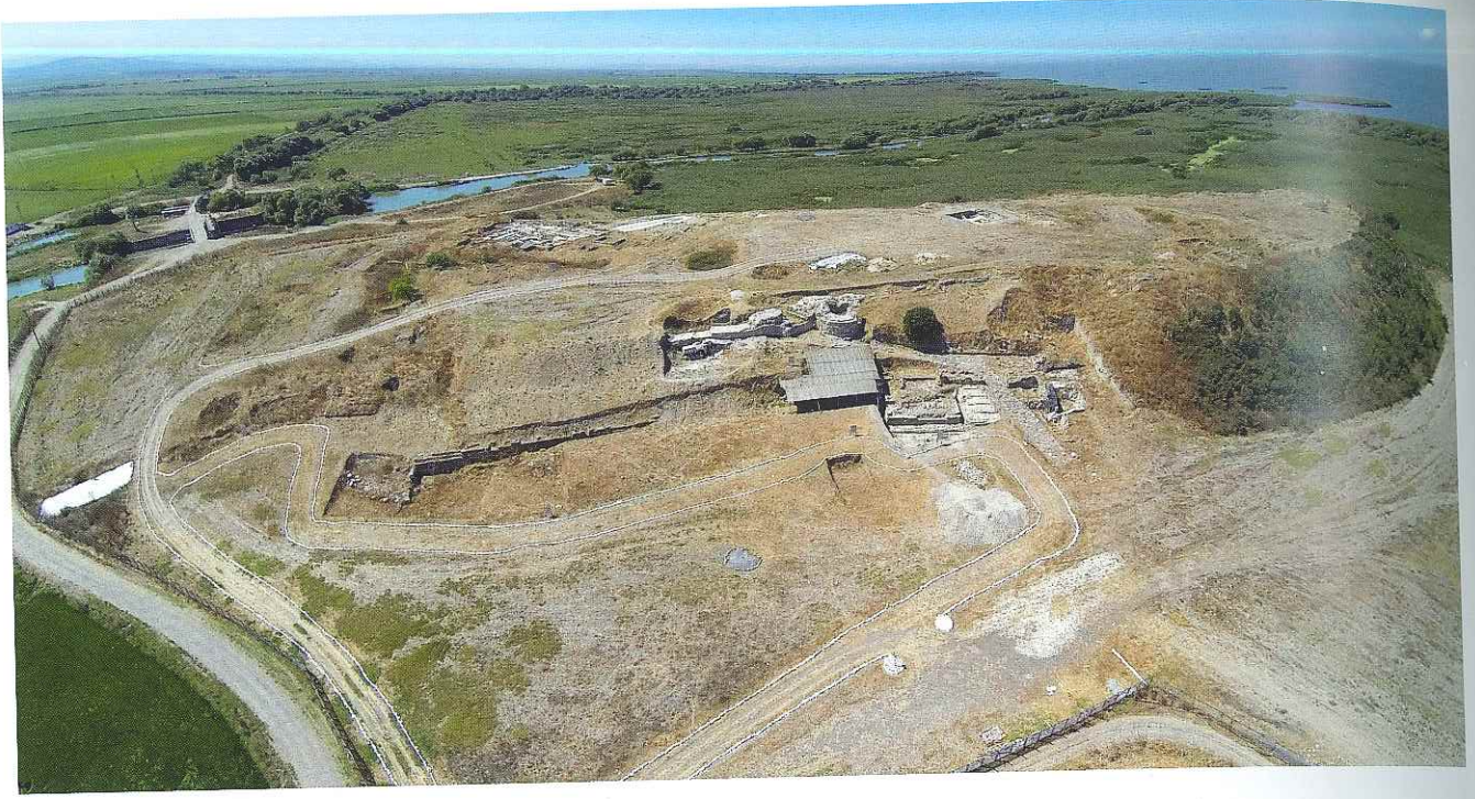
Res. 1: Daskyleion'un üzerine kurulduğu Hisartepe