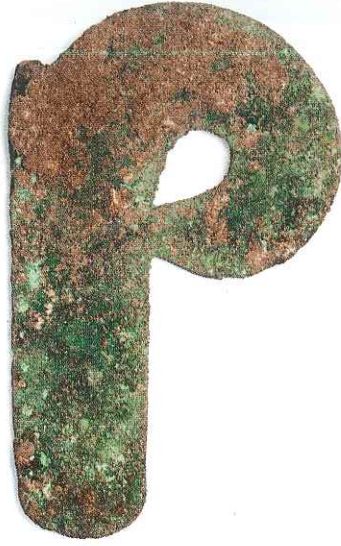
Res. 6: Kocaresul Tümülüsü'nden ele geçen sadak parçası (Daskyleion Kazı Arşivi)