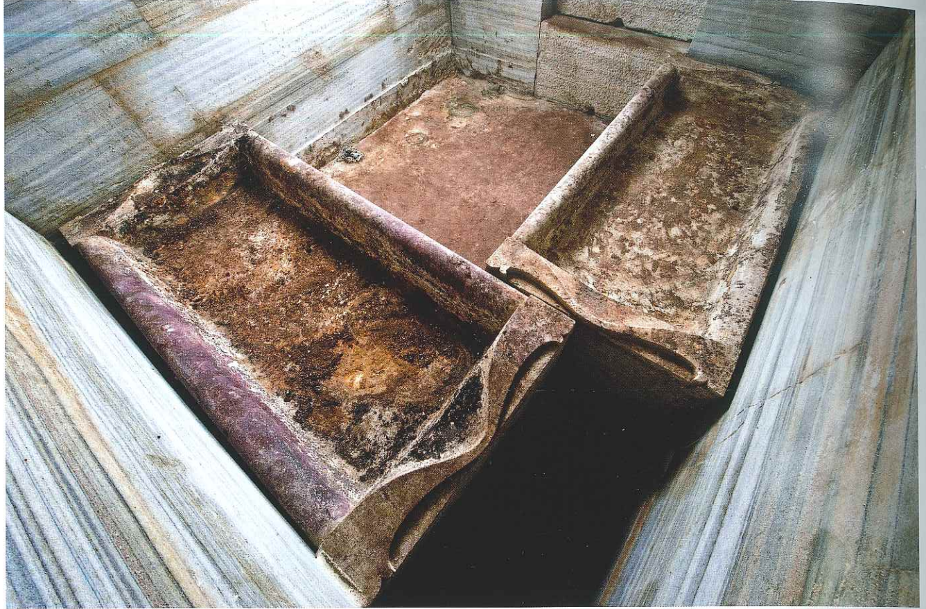
Res. 7: Koru Tümülüsü mezar odasında Lydia tipi mermer klineler