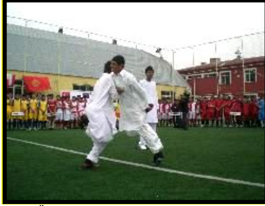
Resim 5 : Öğrenciler Mahalli/Ulusal Sporlarını Oynarken

Okulun uluslararası bir okul olması ve bünyesinde çeşitli ülkelerden gelen öğrencileri barındırması nedeniyle Mustafa Germirli AİHL’de futbol, basketbol ve voleybol gibi bilinen ve tanınan sporların yanı sıra öğrencilerin kendi kültürlerine ait Buzağ, davazda, şaşki, Kazak güreşi, buzkişi, kök börü, avdar ve ateşli top gibi bazı mahalli sporlar da yapılmaktadır (Öner ve Sipahioğlu, 2010, s.1044).