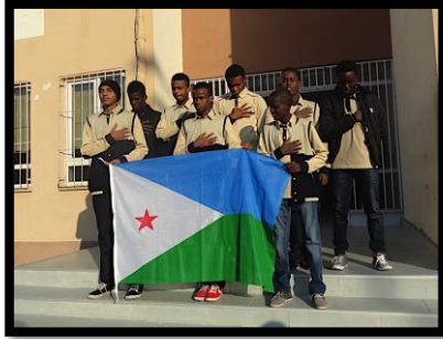
Resim 3 : Okul kıyafetleriyle Cibuti’li öğrenciler

Mustafa Germirli AİHL de öğrenciler; kışın lacivert ve toprak rengi pantolon ile toprak rengi swet short ve yelek giymektedirler. Yazın ise öğrencilerin kıyafeti; lacivert ve toprak rengi pantolon ve toprak rengi tişört olmaktadır. Hava koşullarına göre öğrenciler okulda yazlık veya kışlık kıyafetlerini giymektedirler. Mustafa Germirli AİHL’de kılık kıyafet konusunda öğrencilere tanınan özel ve istisnai bir uygulama, öğrencilerin Cuma günleri öğleden sonra yerel ya da ulusal kıyafetleri ile okul içinde serbestçe dolaşabilmeleridir (Resim 4).