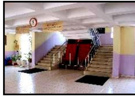
Resim 2. Okul Binasının Giriş Katı.