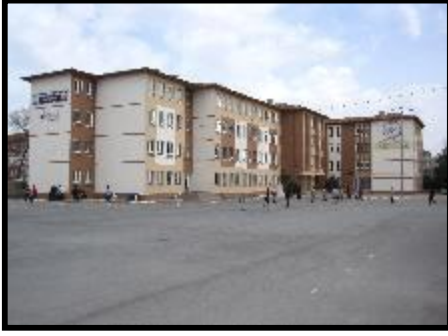
Resim 1. Okulun Genel Görünümü.