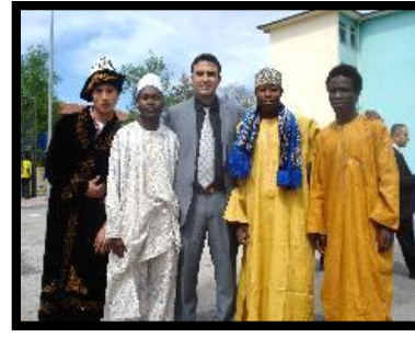
Resim 4 : Yerel kıyafetleriyle öğrenciler