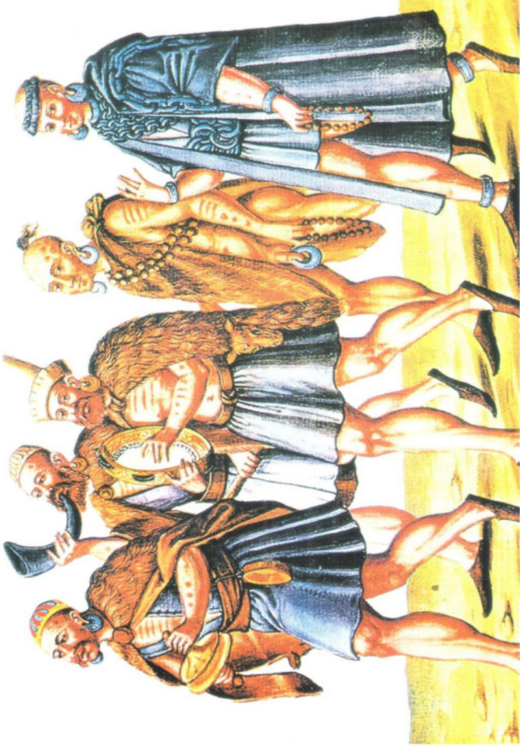
XVI.yüzyılda bir Bathı ressamına göre bir grup Kalenderi (XVI. yüzyılda İstanbul: Kent-Saray-Gırtluk Yaşam, İstanbul 1993, Akbank Yayını)