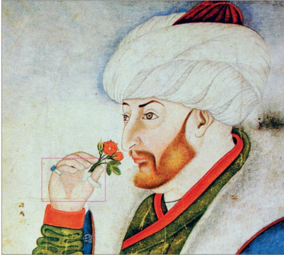
Fâtiḥ Sultan Mehmed'in "Gül Koklayan Fâtiḥ" portresinde parmaklarındaki mühür yüzükle okcu yüzüğü (TSM, Hazine, nr. 2153, vr. 10')