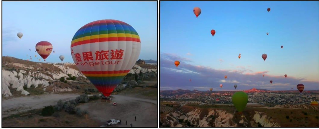
Şekil 2: Nevşehir'de Sıcak Hava Balonlarından Görünümler

ekonomik geliri haline gelmiştir. Kapadokya’da sıcak hava balonculuğu yalnızca ülkemizde değil yurtdışından gelen ziyaretçiler içinde en büyük çekim unsurudur (Özen ve Özdemir,2019). Bu yönüyle Kapadokya, balonculuk faaliyetlerinden bağımsız düşünülemez. Bölgeye gelen turistler için hazırlanan tüm turizm ürünlerinde sıcak hava balonu yer almakta ve simgelenmektedir. Esasen sıcak hava balonunda görülmek istenilen manzarayı peribacaları oluşturmaktadır. Çünkü peribacaların bu kadar yoğun ve bir arada olduğu bir topografya ancak Kapadokya’da görülebilmektedir (Şekil 2). Yıllardır bölgenin simgesi ve turizm değeri, peribacaları üzerine kurulmuş olsa da Tucker ve Carnegie (2014)’a göre 1990’lı yıllardan bugüne geçen sürede Kapadokya imajı artık sıcak hava balonlarıyla bir hale gelmiştir. Bu nedenle Kapadokya adına, insanların destinasyon seçiminde en güçlü imajının, sıcak hava balonları olduğunu söyleyebiliriz.