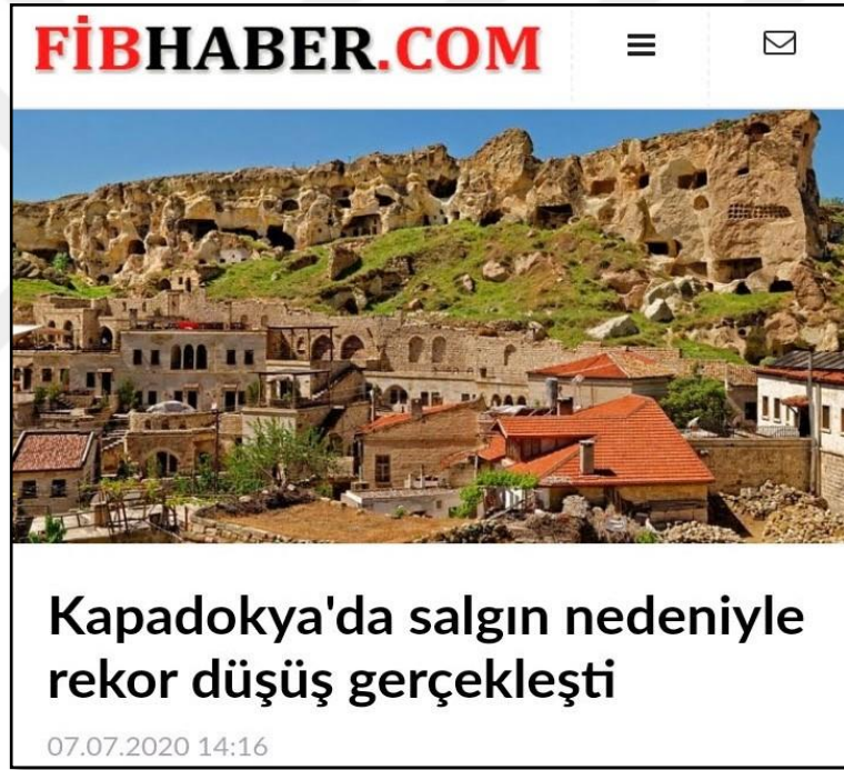
Şekil 5: Salgının Nevşehir Turizmde Meydana Getirdiği Değişime Dair Haber Başlığı (Fibhaber, 2020)

Bu durumla ilgili haberler yazılı ve görsel medyada yerini almış, Nevşehir yerel haber sitesi Ocak ayından Haziran ayına kadar geçen sürede, salgının neden olduğu düşüşe haber başlığında yer vermiştir (Şekil 5).