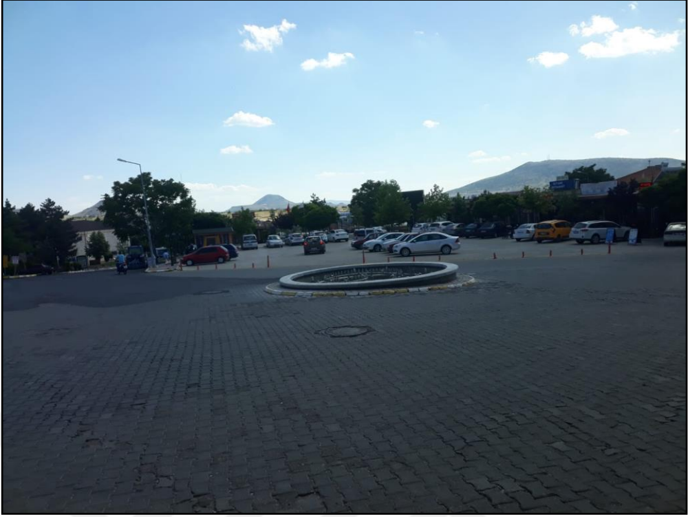
Şekil 7: Uçhisar Meydanından Bir Görüntü (06.08.2021)