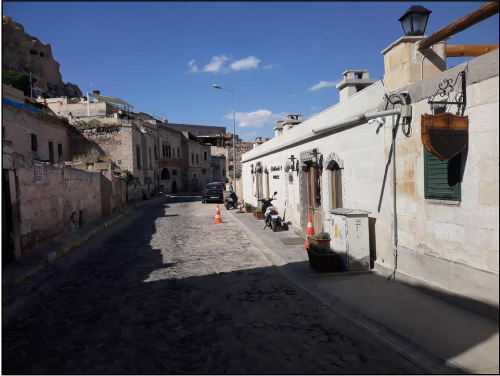
Şekil 8: Avanos Sokaklarından Bir Görüntü (20.05.2021)