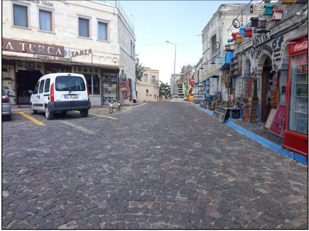
Şekil 9: Avanos'ta Hediyeelik Eşya Dükkanları (20.05.2021)

“28 yıldır burada acente işletmecisiyim. Bizim pek çok işimiz var balon, ATV, at, otel, bir turistin buraya gelip yapacağı her şeyi biz planlıyoruz. İlk defa Nevşehir’i bu kadar boş, bu kadar cansız gördüm. Her şey bir anda bitti. Turizm bitti. Karantina günlerinde sadece biz işletme başındakiler vardı. Caddeler bomboştu. Yani o zamanlar çok etkilenmişim. Bu kadarını asla hayal edemezdim. Ve çok gariptir. Ben virüsün varlığına sokakları bomboş görünce inandım... Ben buraya taşındığımdan beri ilk kez burada balonların kalmadığını gördüm. Bakın burası körfez krizi gördü. Kuş gribi, domuz gribi, aklınıza ne gelirse. Hiçbir zaman balonların bu kadar uzun süre kalmadığını görmedim. Şimdi bu basit bir şey gibi gelebilir size. Ama balonculuk bu bölgenin turizminin ana damarı. Balon kalkmazsa turizm ölür. Ki öylede oldu ölü bir sezon geçirdik.” (Katılımcı-20).