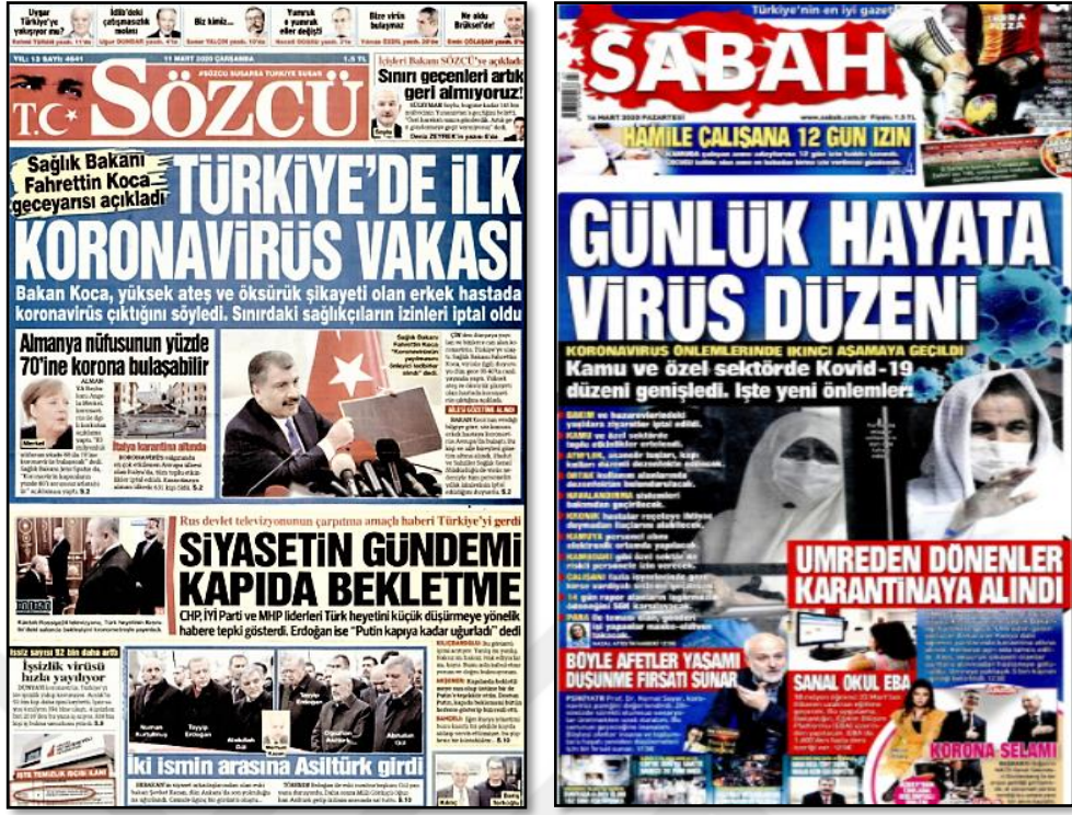
Şekil 4: 11-12 Mart 2020 Tarihli Gazetelerin 1. Sayfalarında Virüsle İlgili Başlıklar

Ülkemizde virüsün ortaya çıktığı ilk zamanlar; salgının yayılmasını azaltmak adına aldığımız kararlar, bazı ülkelere sınırların kapatılması, yolculukların izne tabii olması, otobüs ve toplu bilet satışlarında kapasitenin yarıya indirilmesi çalışmalarımızın asıl konusu olan turizmi de halihazırda etkileyen kararlardı. Ülkeye giriş-çıkış yasakları ve virüsten dolayı yaşanan ölümler insanları derin bir endişeye sürüklemiştir. Öyle ki Covid-19'la ilgili tüm yazılar ve haber başlıkları “Panik Yapmayın Tedbir Alın: Covid-19”, “En Tehlikeli Salgın: Panik” , “Endişeye Gerek Yok” gibi insanların endişe seviyesini düşürmeye yönelik başlıklar olmuştur. Salgının temas yoluyla bulaştığı ve ölümcül bir etkiye sahip olduğu bilgisi, insanları gündelik hayatlarında daha dikkatli olmaya sürüklemiş ve bu bağlamda insanlar için zorunlu olmayan seyahat planları ikinci plana atılan eylemler olmuştur. Bu nedenle incelediğimiz bu dönemi salgın nedeniyle ilk çatlama yaşanmış dönem olarak tanımlayabiliriz.