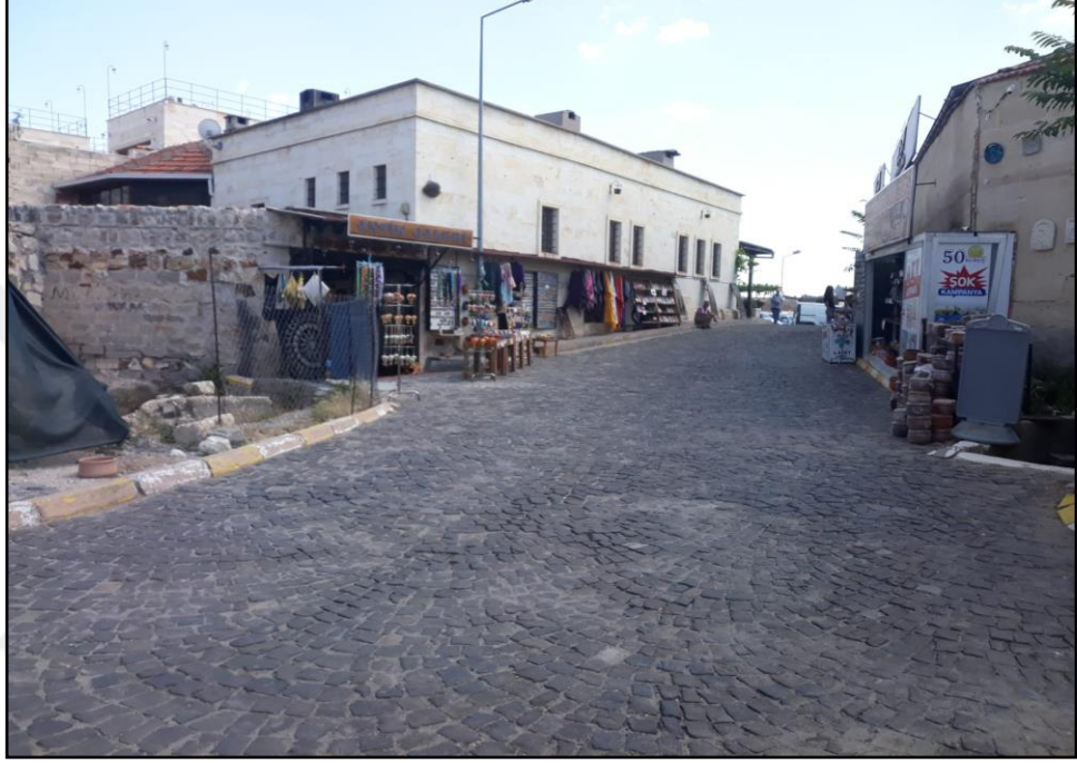
Şekil 6: Göreme Sokaklarından Bir Görüntü

gördüm. Geçen sene (2020) Ortahisar'dan buraya kadar (Göreme) 6 km gelirken ne karşıdan bir araba geldi nede arkadan bir araba geldi. Hiç kimse yoktu. Yürüyen insan görmeye hasret kaldık. Belki bilirsiniz ama Göreme'de yerli yaşayan insan sayısı da çok az. O yüzden turisti geçtim, buranın yerli insanı bile yoktu. Geçen sene nisan mayıs ve haziranda burası tamamen ölü şehirdi. Eğer marketlerde açmasaydı hiçbir yaşam belirtisi göremezdik herhalde.” (Katılımcı-19).