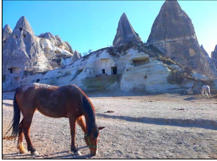
Şekil 3: Göreme'de At Çiftliğinden Bir Görüntü

Kapadokya Bölgesinin doğa temelli yapılan atçılık, ATV turları ve doğa yürüyüşleri de turizmde bölgenin en önemli katma değer unsurlarındandır. Atçılık bunlardan en eskisidir. Öyle ki bölgenin eski bir ismi olan pers dilindeki Katpatuka “Güzel Atlar Ülkesi” anlamına gelmektedir (Altıntaş, 2011: 415). Bölgenin Güzel atlar ülkesi olarak anılması turizm yönünden ayrı bir mana ve değer niteliği taşımaktadır. Bu isim turizm adına bölge için bir çağrışım yaratır. Eski çağlarda bölgede atların yoğun olarak görüldüğü bir bölge olan Kapadokya bölgesindeki atçılık faaliyeti, geçmişten gelen önemli bir kültürel uğraştır. Bu yönüyle bölgedeki atçılık, turizm faaliyeti içerisinde kullanımıyla geleneksel olanın, günümüzde modernle buluşması adına iyi bir örnektir. Bölgede alternatif ve sürdürülebilir bir turizm türü olan atçılık sayesinde, bölgede motorlu araçla gezilemeyecek emsalsiz güzellikteki vadiler, turistler tarafından keşfedilebilmektedir.